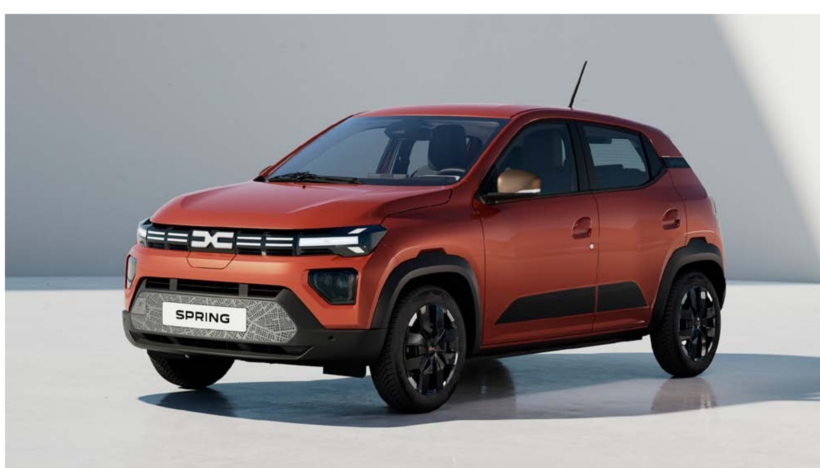
ROUGE BRIQUE (1)