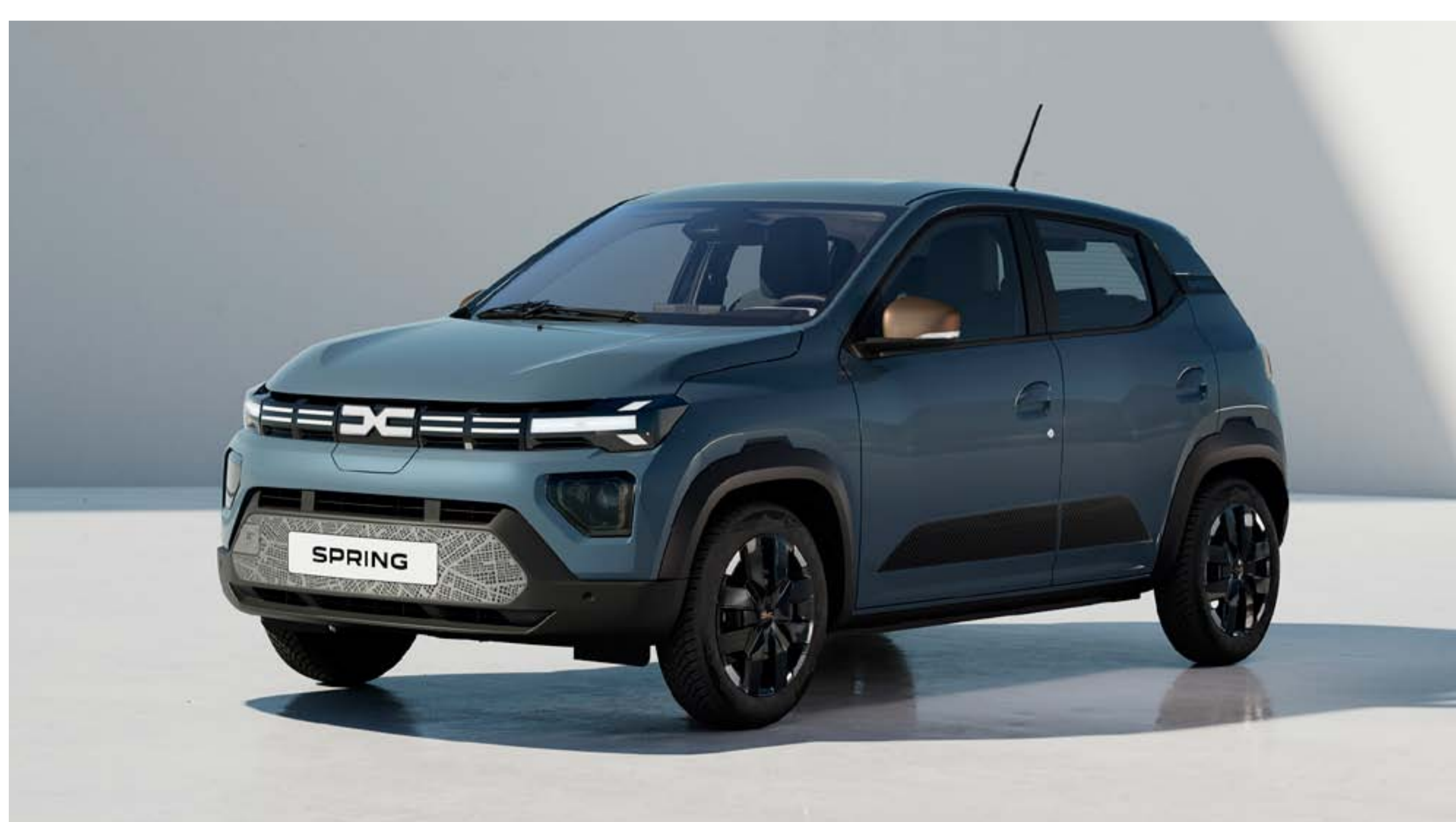
BLEU ARDOISE (1)